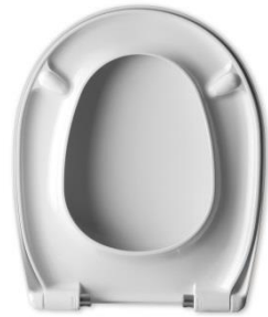
2 Deckelpuffer DP97 2 Sitzpuffer SP15