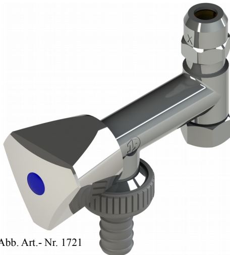
Abb. Art.- Nr. 1721

Artikelnummer: 00 1721 1050 001 mit Standardgriff 00 7121 1050 001 mit Designgriff