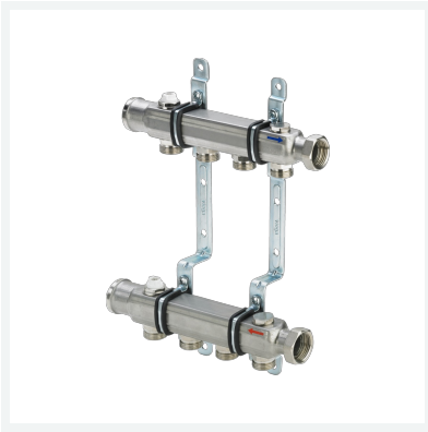
Verteiler Modell 1078 Artikel 587 598