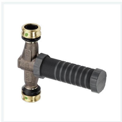
Easytop-UP-Geradsitzventil mit SC-Contur Modell 5335.2 Artikel 758 066