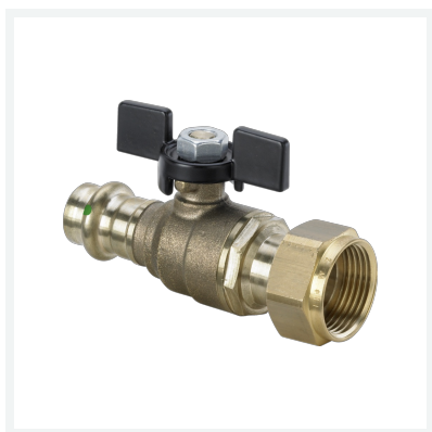
Easytop-Kugelhahn mit SC-Contur Modell 2275.7 Artikel 747 060