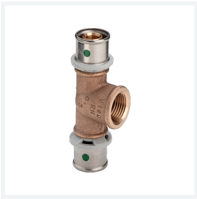
Sanfix P-T-Stück mit SC-Contur Modell 2117 Artikel 566 579