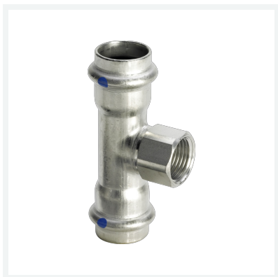
Sanpress Inox LF-T-Stück mit SC-Contur labs-frei (Einzelverpackung) Modell 2317.2LF Artikel 665 647