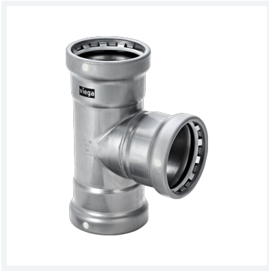
Megapress S XL-T-Stück mit SC-Contur Modell 4218XL Artikel 752 026