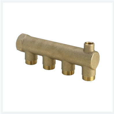
Verteiler Modell 1056-691 Artikel 133 870