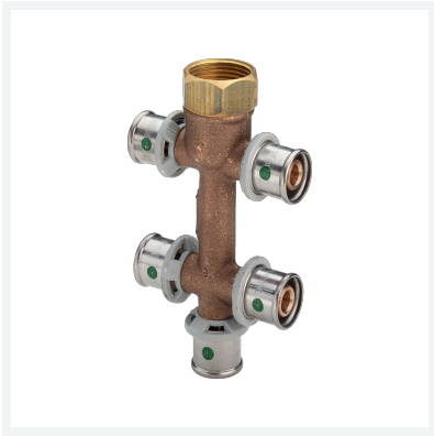
Sanfix P-Verteiler mit SC-Contur Modell 2126.09 Artikel 458 171