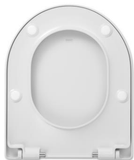
2 Deckelpuffer DPV5 4 Sitzpuffer SPV8