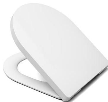
Öffnungswinkel max. 110°