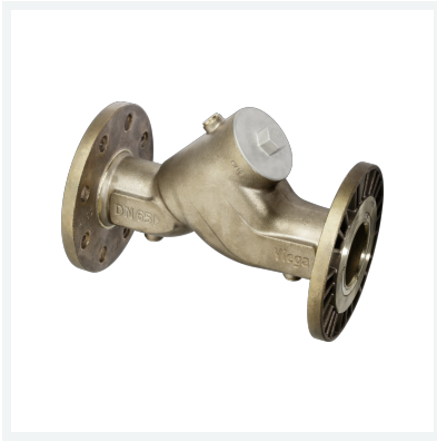
Easytop XL-Rückflussverhinderer Modell 2239.4XL Artikel 757 748