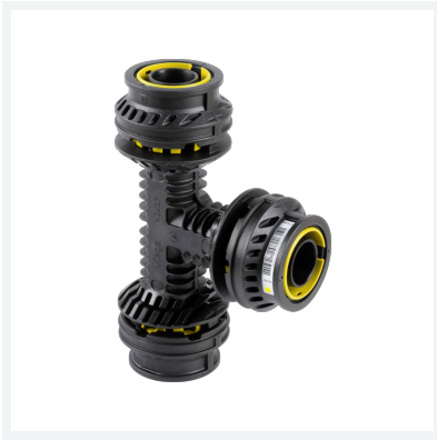
Geopress K Gas-T-Stück mit SC-Contur Modell 9718G Artikel 822 767