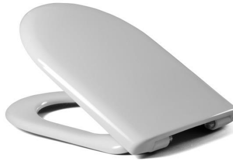
Öffnungswinkel max. 110°