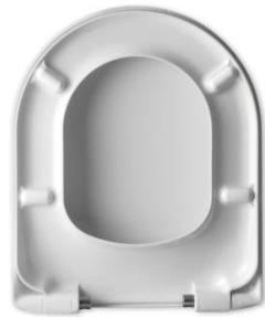
2 Deckelpuffer DP97 4 Sitzpuffer SP97