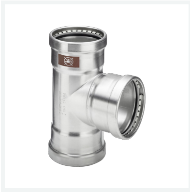
Temponox XL-T-Stück mit SC-Contur Modell 1718XL Artikel 810 207