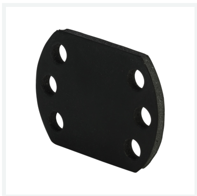
Gummiplatte - für Schrauben M4 Modell 8013.25