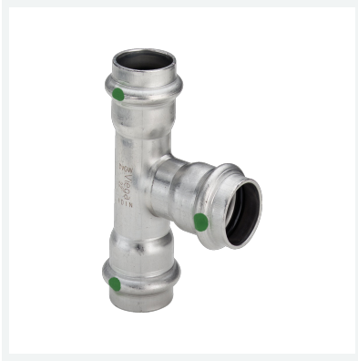
Sanpress Inox-T-Stück mit SC-Contur Modell 2318 Artikel 436 018