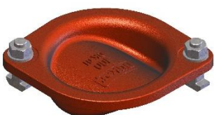
Deckel neue Bauart (Fertigungsdatum ab Januar 2017)) Deckel rund mit Befestigungslaschen, Außenfläche vertieft mit Düker- Beschriftung