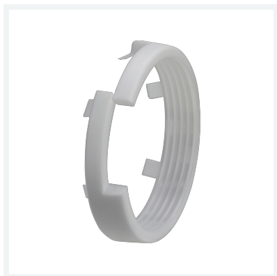
Geopress-Klemmring Modell 9615.8