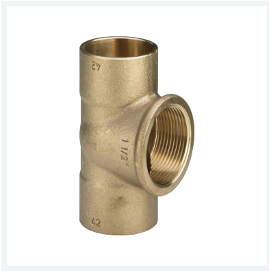
T-Stück Modell 94130G Artikel 101 978