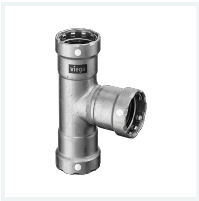
Megapress S-T-Stück mit SC-Contur Modell 4318 Artikel 770 273