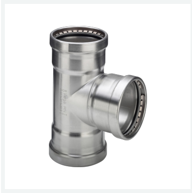
Sanpress Inox XL-T-Stück mit SC-Contur Modell 2318XL Artikel 483 043