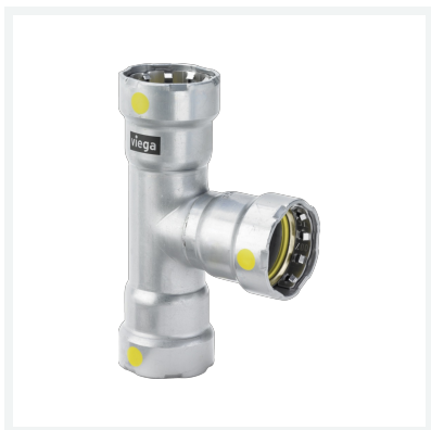
Megapress G-T-Stück mit SC-Contur Modell 4618 Artikel 739 645