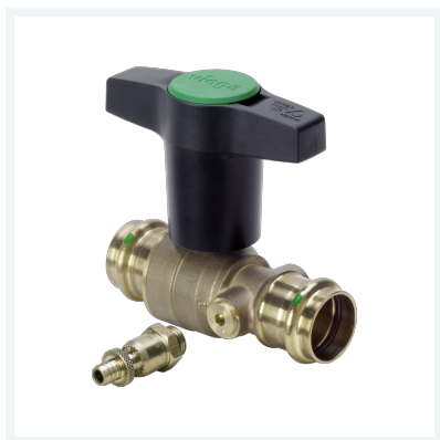
Easytop-Kugelhahn mit SC-Contur Modell 2275.3 Artikel 746 698