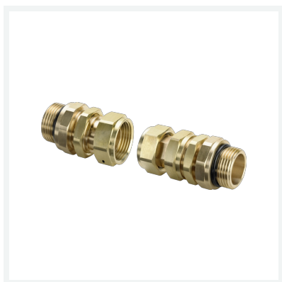
Easytop-Wasserzählerverschraubung Modell 2230.71 Artikel 689 773