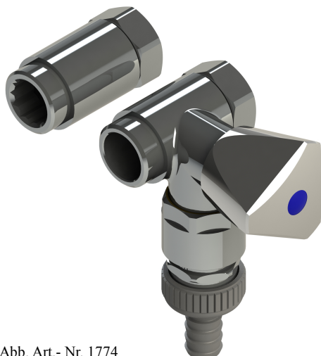
Abb. Art.- Nr. 1774

Artikelnummer: 00 1774 2050 001 mit Standardgriff 00 7174 2050 001 mit Designgriff