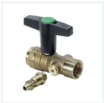
Easytop-Kugelhahn Modell 2275.5 Artikel 746 896