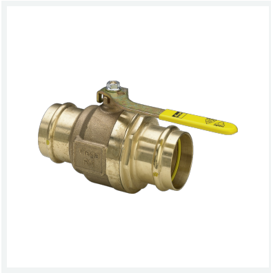
Profipress G-Gaskugelhahn mit SC-Contur Modell 2670 Artikel 492 854