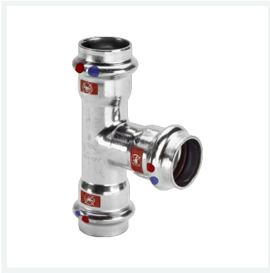
Prestabo LF-T-Stück mit SC-Contur labs-frei Modell 1118LF Artikel 716 493