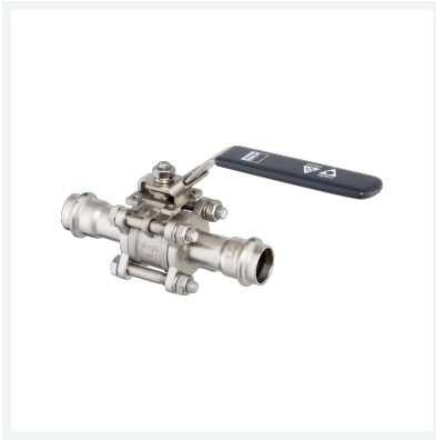
Easytop-Kugelhahn Sanpress Inox-Pressanschlüsse 3-teilig mit SC-Contur Modell 2375.8 Artikel 766 825