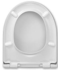
2 Deckelpuffer DP97 4 Sitzpuffer SP97