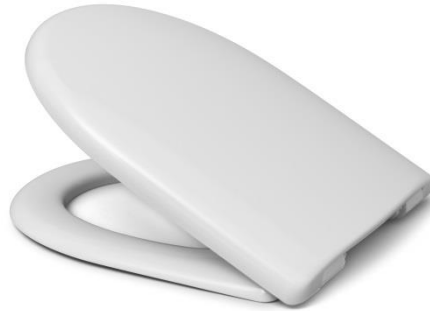
Öffnungswinkel max. 110°