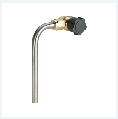
Easytop-Probenahmeventil Modell 2223.4 Artikel 708 740