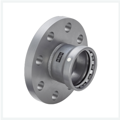
Megapress S XL-Flanschübergang mit SC-Contur Modell 4259XL Artikel 751 883