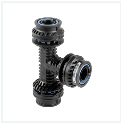
Geopress K-T-Stück mit SC-Contur Modell 9718TW Artikel 822 729