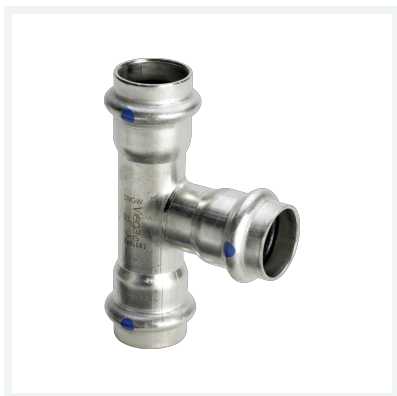
Sanpress Inox LF-T-Stück mit SC-Contur labs-frei (Einzelverpackung) Modell 2318LF Artikel 665 180